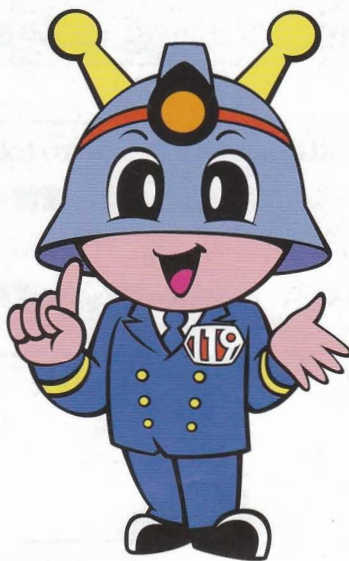
東京消防庁マスコット「キュータ」