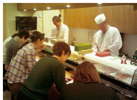
烏山まちゼミの一風景 海苔巻寿司のつくり方を学んでいます