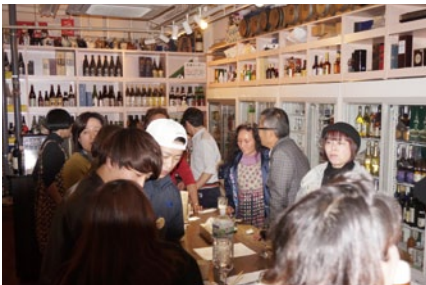
喜多見バルです。地下立ち飲みコーナーで牛のタタキとワインをいただきました