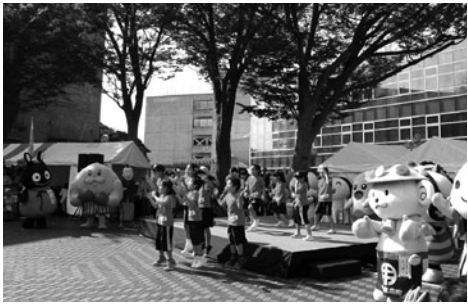
ゆるキャラも子どもたちと一緒に踊りました

当日は好天にも恵まれ、世田谷区内の商・工・農の各種団体や学校の展示を多くの皆さんに見て頂きました。また、今年も区内商店街のゆるキャラも子どもたちと一緒に踊りました