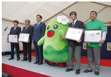
尾山台駅周辺4商店街のキャラクターです

10月17日(土)開催された第28回尾山台フェスティバルで、区長から、特別住民票が交付されました。