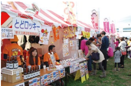
とどろッキーのお店では「とどろき溪谷ビール」も売ってます

「一万人が初冬の多摩川でいちいち商店街を体験しました」11月29日(日)多摩川河川敷兵庫島公園で「いちいち商店街」が開催されました。企画したのは商連玉川地区16の商店街です。ちよつぱり汗ばむ青空のもと、多くの家族連れでにぎわいました。逆バンジー、のるるんの「ふわふわ」に子どもは興奮。そしておまわりさんになり、銀行員になったり、屋台をお手伝いして専用通貨「がくやん」をゲット。使い方は自由です。お店のお兄さんと気持ちのいい合うつおとなになったかも! 大人と子どもが一緒になって楽しんだ一日でした。