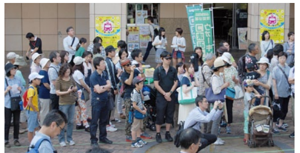
三軒茶屋駅前での多くの参加者がスタートを待っています

11商店街、81のお店を巡り、商店自慢の食べ物や日用品を無料です。先行予約400人を含む約1900人が参加、みんなの笑顔が素敵でした。