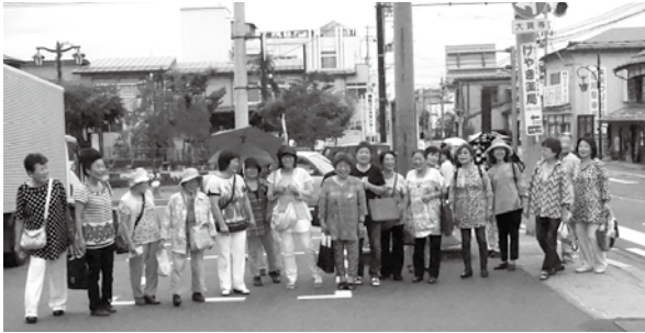
まちなみ協会の皆さんと七日町通りを散策しました

女性部夏期研修会は9月3・4日、福島県会津若松市「七日町通りまちなみ協議会」で行いました。近代化の波に立ち遅れた中心市街地を立て直すため、まちなみ協議会が平成6年に設立され、「大正