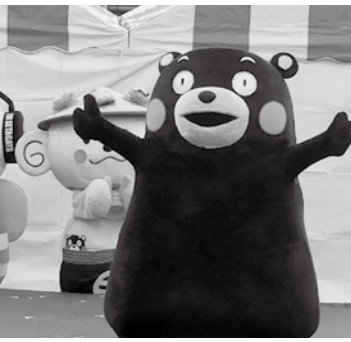
昨年は「くまもん」が体操しました

て開催されます。運営は、各種団体から実行委員の参加を得た上で行われますが、例年商連青年部長が委員長を務めています。実行委員会の中では様々な提案が有りましたが、昨年好評だった区内商店街のゆるキャラコンテストをもう一度開催します。