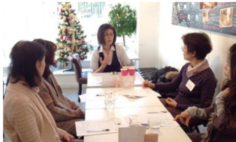
作りおきクリームアロマの香りでお肌モチモチ♡お好み講座です

4 商店街(二葉会、尾山台振興会、尾山台商業会、尾山台東栄会)が主催し、26年11月は33のお店が40講座を開きました。まちゼミはチラシが大きなポイントで、特に重要なのが講座の