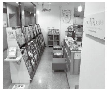
世田谷のまち・イベント情報を募集中