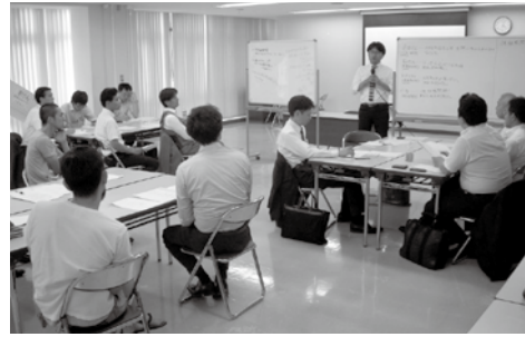
意見交換のパネル発表です

商人塾は、6月にスタートして順調に推移し9月までで3回のカリキュラムを終了しました。今期の商人塾は、塾生二人ひとりが講師から示されたテーマに對