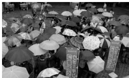
傘・傘の三軒茶屋スタート地点

今年度も昨年に引き続き、商店街や街をきれいにして、お客様に気持ち良くお買い物をして頂けるように、11月3日を中心に商店街清掃活動として「クリーンプロジェクト」を実施しました。 それぞれ、商店街を利用して地域の皆さんに多数参加頂きながら無事に終わりました。 活動を通じて、商店街への理解をより一層深め商店街への加入が促進されるよう、今後も継続した運動を続けていきますので、ご支援を宜しくお願いします。