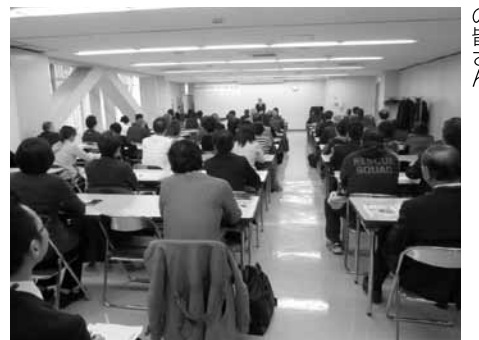
月28日に開催されました。

喚起を促した大量生産、大量消費の時代で、こうした時代を経て現代社会が成り立ち、日本のマーケティングを大きく変質させた時代であるとのことでした。