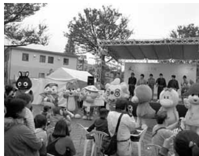
歓声をあびた「ゆるきゃら」が大集合

電子マネーやカード化の時代を迎え徐々にスタンプの発行額が減少すると共に扱う商店街の数も減りました。 そこで、スタンプ研究会では販売促進活動とは何かとの原点にもう一度立ち戻り、多くの商店街の皆さんが参加できる販売促進事