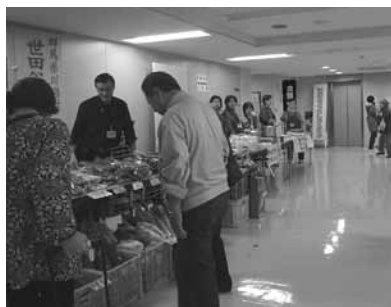
川場村の皆さんと一緒に頑張る女性部員です

第10回「せたがや未来博」が、来につなげよう「せたがやの夢」をテーマに10月19日・20日の両日