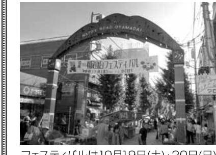
フェスティバルは10月19日(土)・20日(日)の開催です

「ハッピーロード尾山台」の愛称で親しまれる尾山台商栄会商店街は、東急大井町線尾山台駅と環状八号線を直線につなぐ街路樹と石畳の商店街です。当商店街は年2回のセールのほか、一年を通じてさまざまなイベントを開催しています。