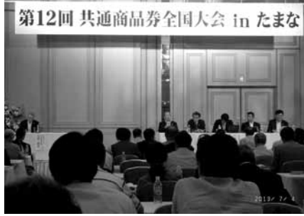
共通商品券全国大会でのパネル討論

優良商業地視察研修会は、第37回を数え「第12回共通商品券全国大会 in 玉名」の開催に合わせ7月4日(木)～6日(土)に実施しました。 会場となった、熊本県玉名市には全国から会員が集まり「コミュニティの中核としての商店街づくり」