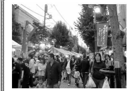
ハッピーロードは尾山台駅から環八まで続いています

第12期の世田谷商人塾は、昨年度から取り入れたゼミ方式でスタートしました。9月18日に政所先生の講義終了後、各ゼミのゼミナールを開きテーマの設定や運営方法を話し合いました。