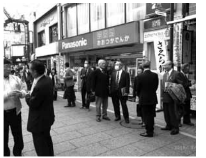
まち並みについて話し合う参加者

今年度の先進商業地視察研修会は、ドイツのブレーメン市と友好関係を結び、環境問題への対応等独自の商店街活動を展開している川崎市の「モトスミ・ブレーメン通り商店街振興組合」を3月8日に視察しました。 当日は、好天にめぐまれ三軒茶屋からバスで目的地向かい、会場となった川崎市立国際交流センターには、青年部員