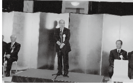
新年の挨拶をする桑島会長

今年の賀詞交歓会が、例年通り1月8日(火) レストラン・スカイキャロットで開催されました。