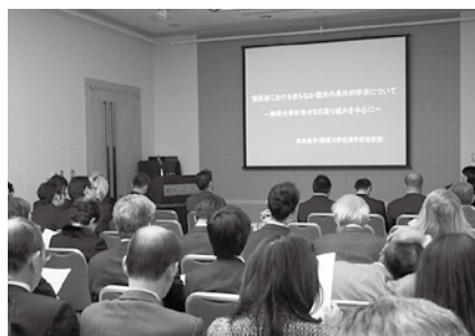
青年部の総会の様子です

講演は、せたがやの「まちなか観光」「全国の商店街によるまちなか観光」の事例「世田谷区の魅力を発信するための「せたがや検定」等、松本ゼミの取り組みを中心に豊富な事例を基に講演をしていただきました。