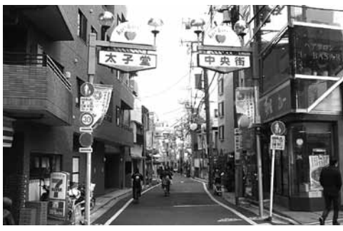
あい・あい・ロード」として親しまれています。

3月1日、太子堂中央商店街が振興組合になりました。長らく中央商店会でしたが、ついに振興組合になったのです。世田