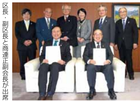
区長、副区長と商連正副会長が出席