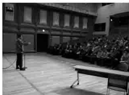
笑顔いっぱいの研修会