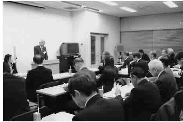
(社)日本資金決済業協会からの説明

URL: http://www.tokyo-cci.or.jp/setagaya 〒154-0004 世田谷区太子堂2-16-7世田谷産業プラザ2階 TEL:03-3413-1461